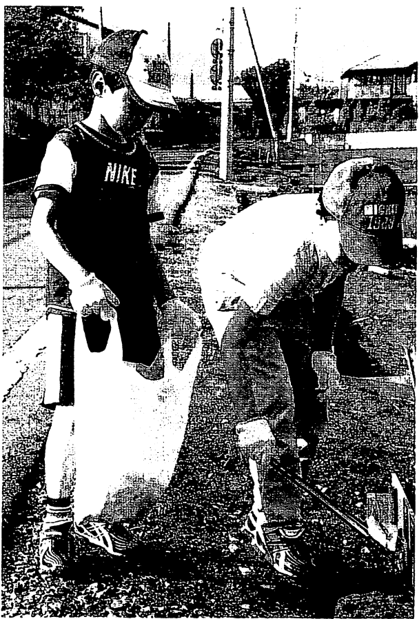
細かいごみまで目を光らせてごみを見つけます